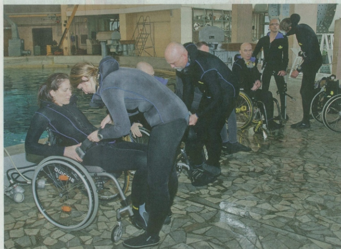
Za potapljanje ni treba biti nikakršni superman.

»Med morskimi psi na Kubi je bilo nekaj posebnega. Brez kletke so morski psi plavali okoli nas. Hujše ga incidenta še ni bilo, čeprav gre za tretjo najnevarnejšo vrsto morskih psov, podarji pomen svojega najljubšega potopa.