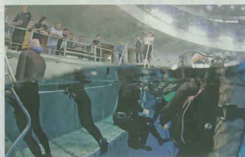
Potapljaška delegacija, v kateri je bilo tudi pet invalidov, se je potopila v »sveto vodo«, ki predstavlja mejo med Zemljo in vesoljem.

Članica potapljaškega kluba Adriatic je že od začetka, kar pomeni deset let, in bolj izkušen od nje je le Aleš Povše alias Voda, ki je med vsemi »najbolj odlikovani potapljači«. Potapljal se je v Rdečem morju, na Kubi z morskimi psi, v bližini potapljaške križarke Costa Concordia.