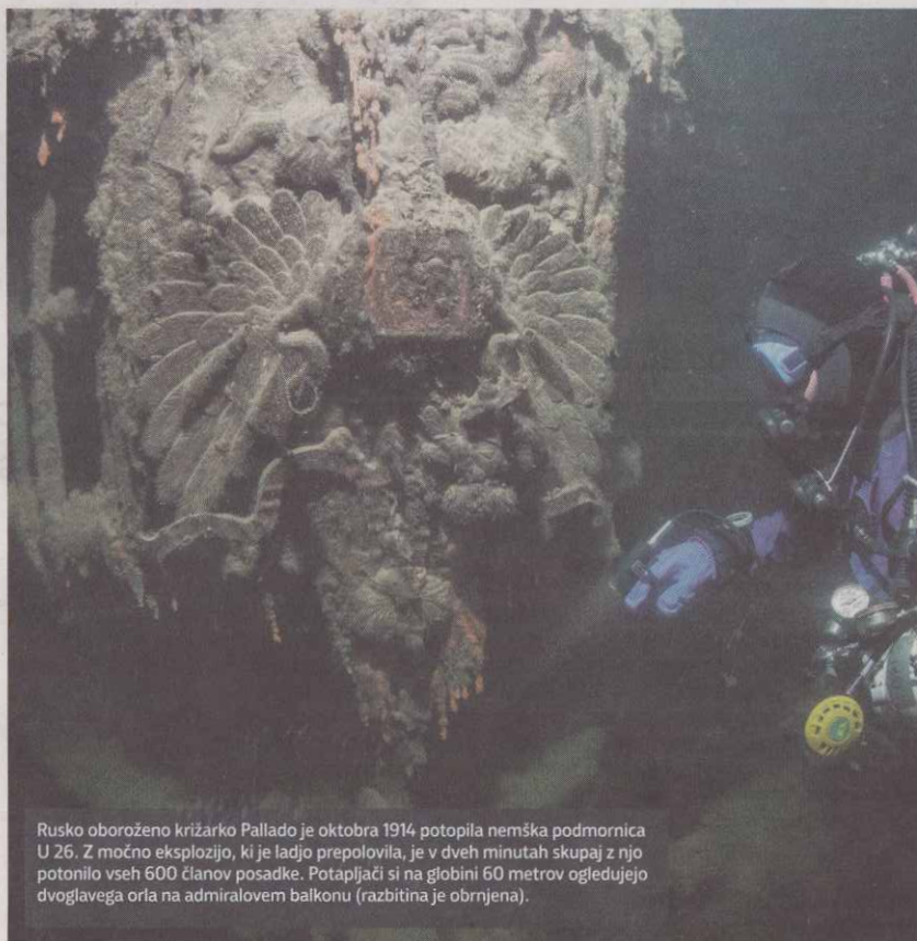
Rusko oboroženo križarko Pallado je oktobra 1914 potopila nemška podmornica U 26. Z močno eksplozijo, ki je ladjo prepolovila, je v dveh minutah skupaj z njo potonilo vseh 600 članov posadke. Potapljači si na globini 60 metrov ogledujejo dvoglavega orla na admiralovem balkonu (razbitina je obrnjena).