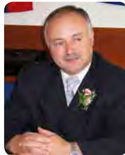
Predsednik Dane Kastelic

Da se bodo društva lažje prebijala skozi različne novosti na področju finančnega in materialnega po-