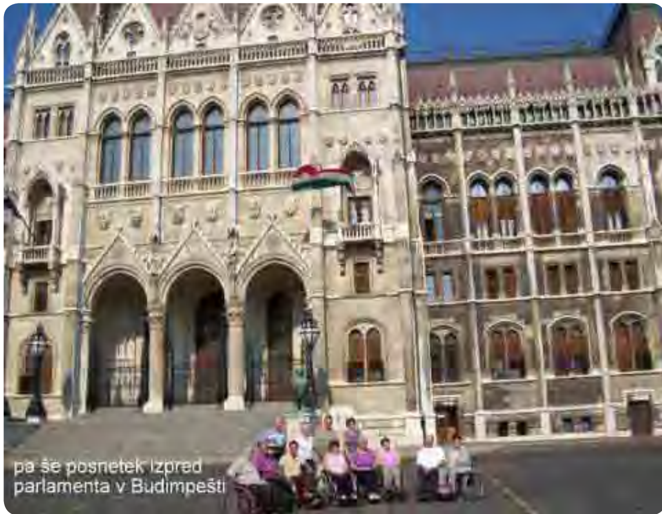
pa še posnetek izpred parlamenta v Budimpešti

Skupinska fotografija pred parlamentom v Budimpešti.