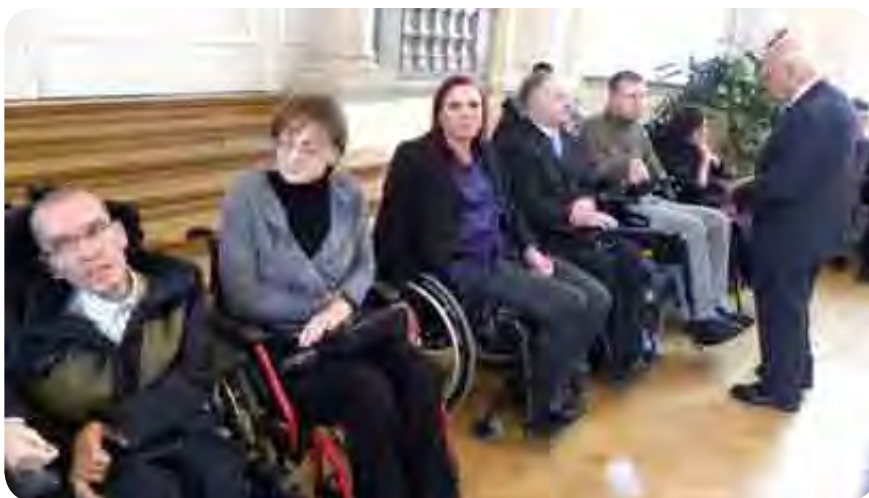
Predstavniki invalidskih organizacij na sprejemu