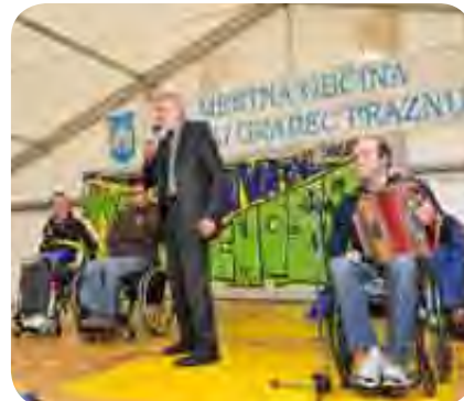
Prireditev Festival drugačnosti smo izvedli že tretjo leto zapored in bo tradicionalna, saj je dobila svoj prostor v okviru prireditev ob praznovanju mestne občine Slovenj Gradec.