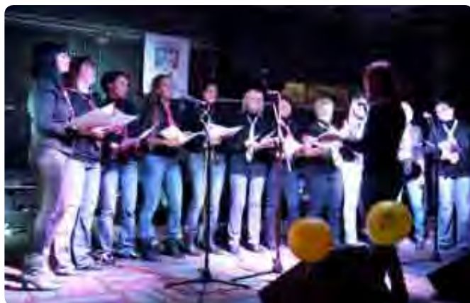
Na dobrodelnem koncertu je bilo presenečenje nastop pevk pevskega zbora ŠIŠKE, ki so navdušile z repertoarjem skupine Siddharta.

Medse bodo rade volje sprejeli nove interesente. Informacije lahko poiščete na naslovu leopostojna@gmail.com ali na Facebooku: http://www.facebook.com/home.php?#%21/group.php?gid=71964887457