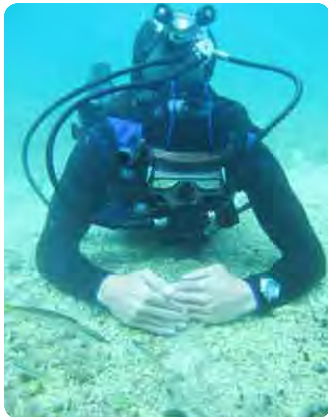
Svet pod vodno gladino govori zase