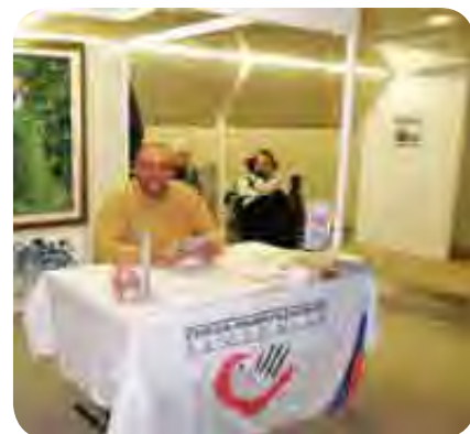
Poleg demonstracije slikanja smo ponudili obiskovalcem tudi kup pomembnih informacij o Zvezi paraplegikov Sloveniji.