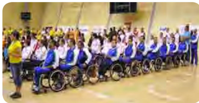
V ospredju ekipa Slovenije

Na prvenstvu, kjer je tekmovalo deset ekip, je prvo mesto osvojila Nizozemska, drugo Švica, tretje pa Bosna in Hercegovina. Poleg omenjenih ekip so