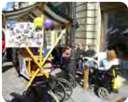
Na stojnici smo predstavili dejavnost društva

Pri evropskem tednu mobilnosti, ki se je končal 22. septembra z dnem brez avtomobila, je sodelovalo tudi Društvo paraplegikov ljubljanske pokrajine. Na Stritarjevi ulici v mestnem jedru smo imeli svojo stojnico, kjer smo z različnimi publikacijami in številnimi fotografijami predstavili dejavnost našega društva in vlogo, ki jo imamo paraplegiki in tetraplegiki v družbenih tokovih Ljubljane.