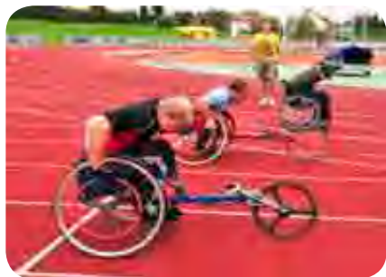
Tekmovanje v hitrostnih vožnjah