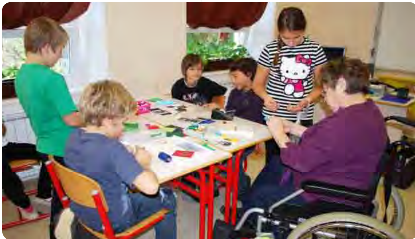
Tudi otroci so ustvarjali