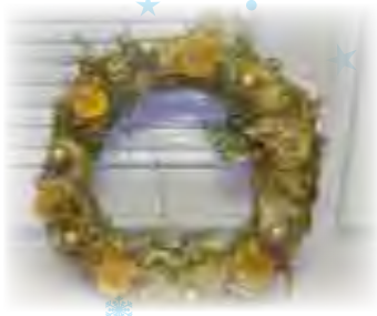
Božični venčki iz DP Koroške