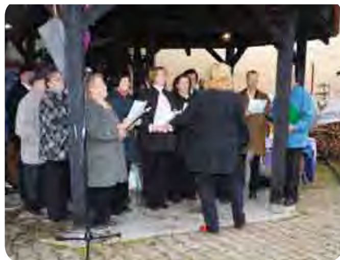
Dogodek je obogatil mešani pevski zbor Društva upokoencev Semič.