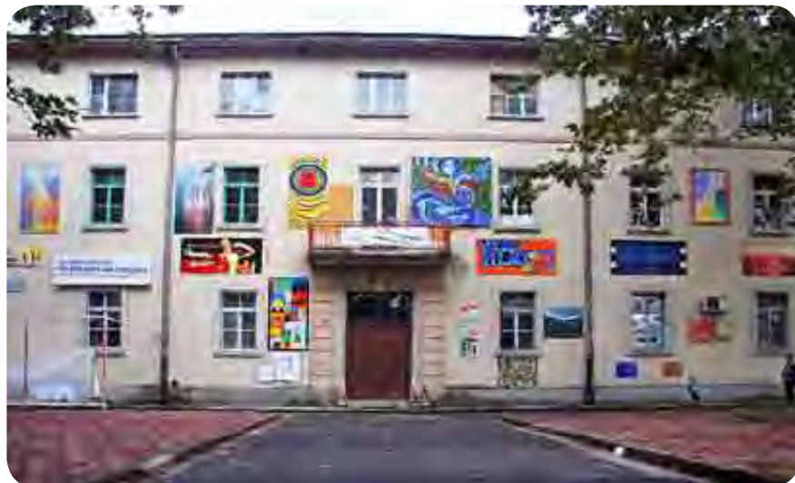
Pročelje Hiše mladih