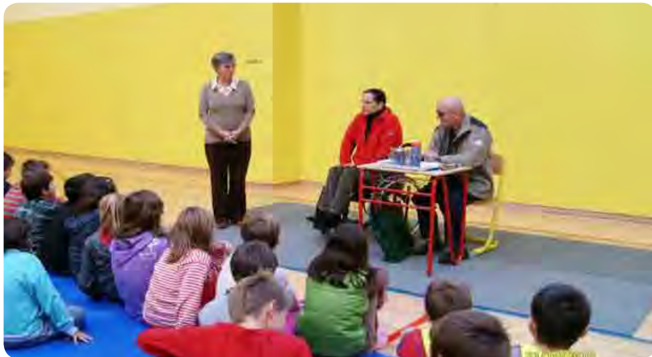
Izobraževalno in zabavno druženje z učenci