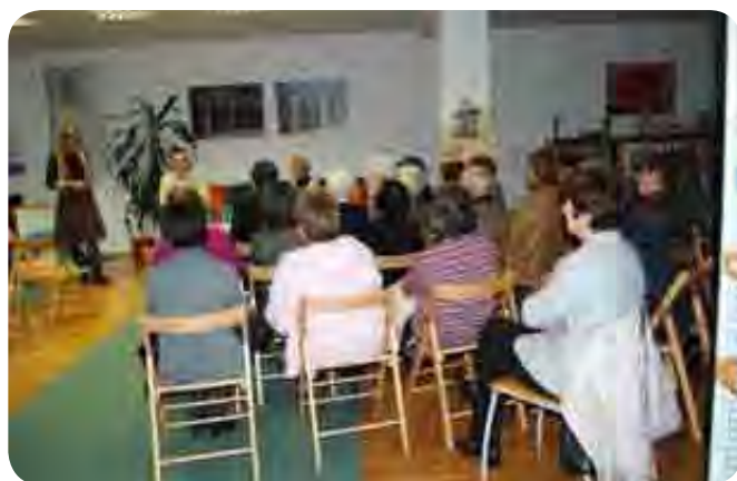
Pogovor je avtor podkrepil s svojo poezijo in o njej tudi spregovoril.