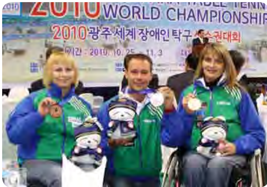
Prva ekipna medalja na svetovnih prvenstvih.