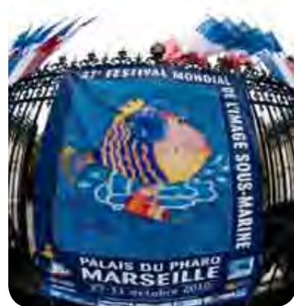
Najstarejši in največji

Film predstavlja trening rekreativnih potapljačev invalidov s poškodbo hrbtenjače, ki je bil