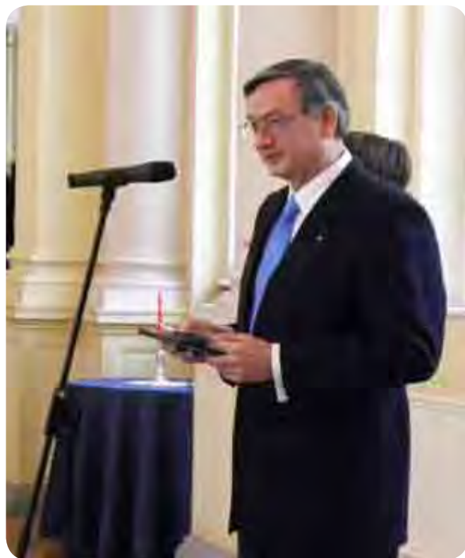
Dr. Danilo Türk je poudaril pomembnost vloge reprezentativnih invalidskih organizacij.