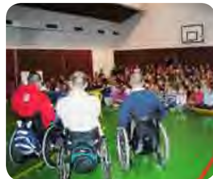
Učenci so z zanimanjem prisluhnili našim življenjskim zgodbam.

V novembru smo bili spet na OŠ Sodražica. Učencem od prvega do petega razreda smo poslanstvo društva in življenje ljudi s poškodbo hrbtenjače predstavili v petih delavnicah. V prvi se je predstavila plesna skupin STEP'N'ROLL, druga je bila namenjena predstavitvi društva, tretja kulturi in interesnim dejavnostim, četrta športu, peta pa arhitekturnim oviram.