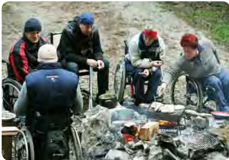
Brez ognja je preživetje v naravi težko.

Veliko sem vas opazoval, tako kot to počnem pri drugih usposabljanjih, da opazim tisto, kar je večini skrito, kdaj se boste dejansko razumsko in duševno »prevagali« iz miselnega vzorca modernega življenja v improvizirano in logično življenje. Med vami so bile tudi ženske in te so najprej naredile ta preskok, moški pa šele pozneje. Imeli