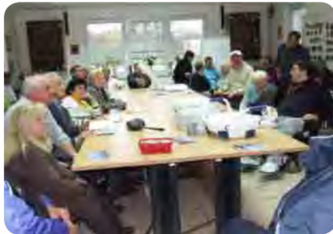
Zanimanje za to predavanje je bilo izredno veliko.

Da si bodo uporabniki olajšali celoten postopek, so ob koncu skoraj dvournega predavanja dobili