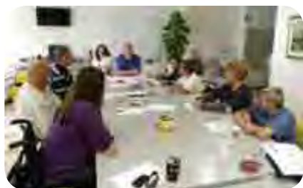
Poverjeniki se sestajajo vsake tri mesece.

Socialni poverjeniki društva so s člani redno povezani in jih ob različnih priložnostih tudi obiskujejo. Vsake tri mesece se sestanejo v društvu, da pogledajo, kako dobro opravljajo svoje poslanstvo, pre-