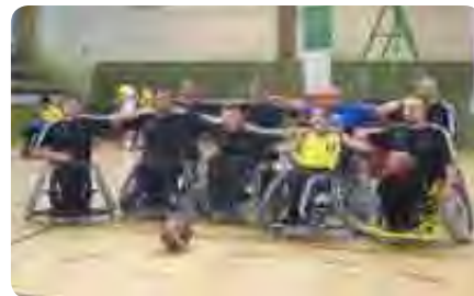
Ekipa DPSŠ Maribor, ki je tekmovala na mednarodnih turnirjih.