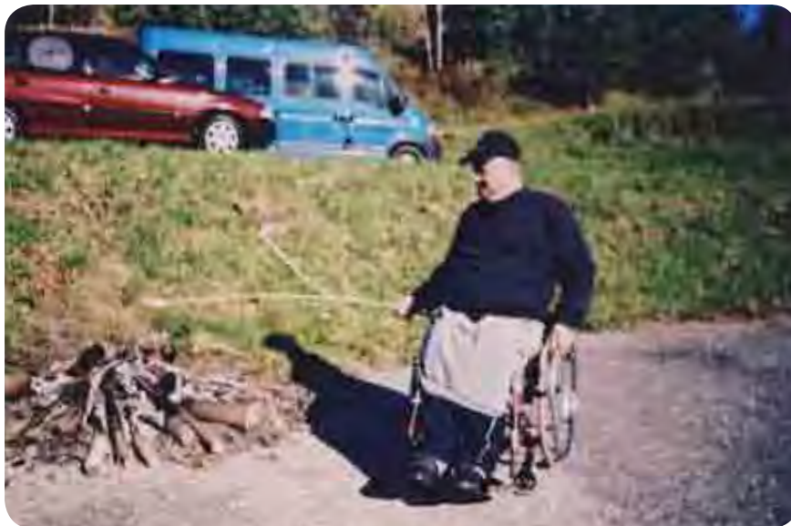
Predsednik prikazuje način peke klobase.

Znano je, da h kostanju spada tudi mladi mošt. Seveda ga tudi v Oseku ni manjkalo in kmalu se je začela sladka pojedina, ki smo jo dobro zalili s sladkim moštom.