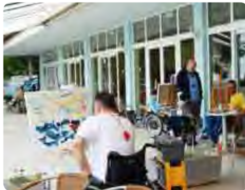
Na ploščadi ob obali smo ustvarjali in se družili.

V Ankaranu se naslednje leto gotovo spet vidimo, saj je ob morju vedno prijetno in zabavno, obenem