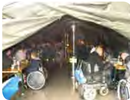
V varnem in toplem zavetju šotora

Zadnja leta pa z našimi tradicionalnimi srečanji res nimamo sreče, saj nam jih je kar nekajkrat krojilo dežja, ki je že dan pozneje povzročil katastrofalne poplave, morali odpovedati ogled botaničnega vrta na Krokarjevi jasi na Zaplani, zatem pa še ogled znamenitega Tomazinovega mlina z zemljankami.