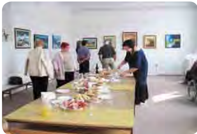
Na razstavi v Brjah smo bili deležni kulture in kraških dobrot.