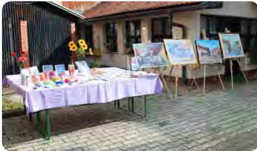
Z razstavo so se predstavili naši slikarji, z ročnimi izdelki pa članice pokrajinskih društev.

ki nas že skoraj tri desetletja gostoljubno sprejema takšne, kot smo. Za uspešno nadgradnjo medsebojnih odnosov pa bomo del svoje pozitivne energije z veseljem zagotovo prispevali tudi sami.