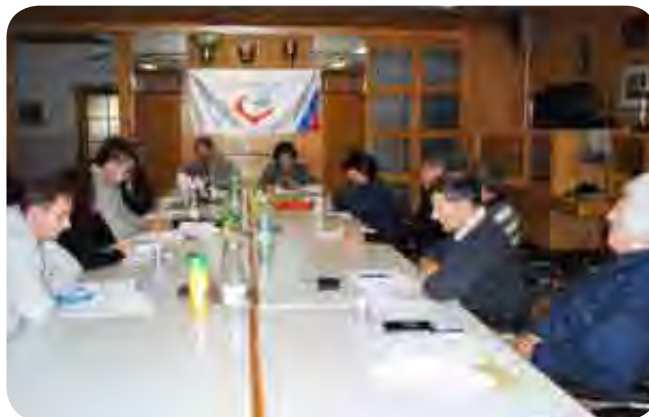
Predsedniki in namestniki nadzornih odborov društev in Zveze na izobraževalnem posvetu

Lahko bi rekli, da je sicer dobro opravljen nadzor, brez ustreznega in podpisanega zapisnika, kratko malo nič. V zapisniku ob koncu poslovnega leta mora biti tudi sklep o podatkih inventurne komisije. NO je tisti, ki mora podati oceno, ali