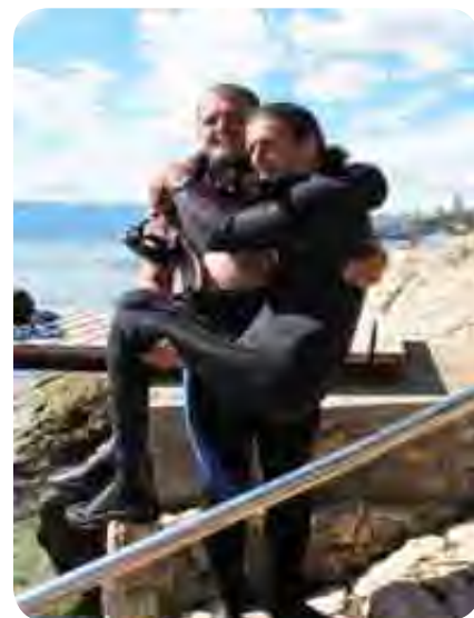
»Ta živi« in »ta zdravi«

dolgčas mi je bilo in sem si s tem zapolnjeval čas. Poleg vsega sem se