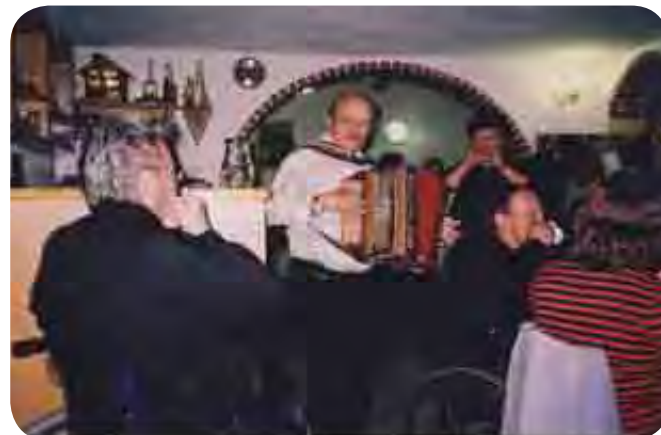
Miha tudi tokrat spremlja muzikantka na bršljanov list.

podali na prijetno kmečko domačijo. Vinotoč leži na hribčku z lepim razgledom na okolico. Še posebno lepo se vidi Slovenska Bistrica, najbolj pa nas je razveselilo, da stavba nima nobenih stopnic in ima za invalide pri-