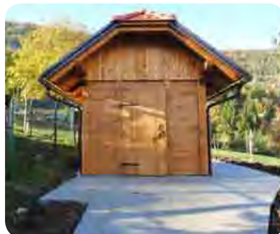
Do večnamenskega vinskega hrama na vzpetini vrta vodi betonska panoramska potka.