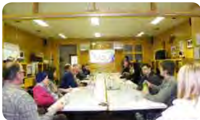
Novinarska delavnica je potekala v sproščnem vzdušju.