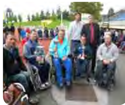
Pokali za zmagovalne ekipe