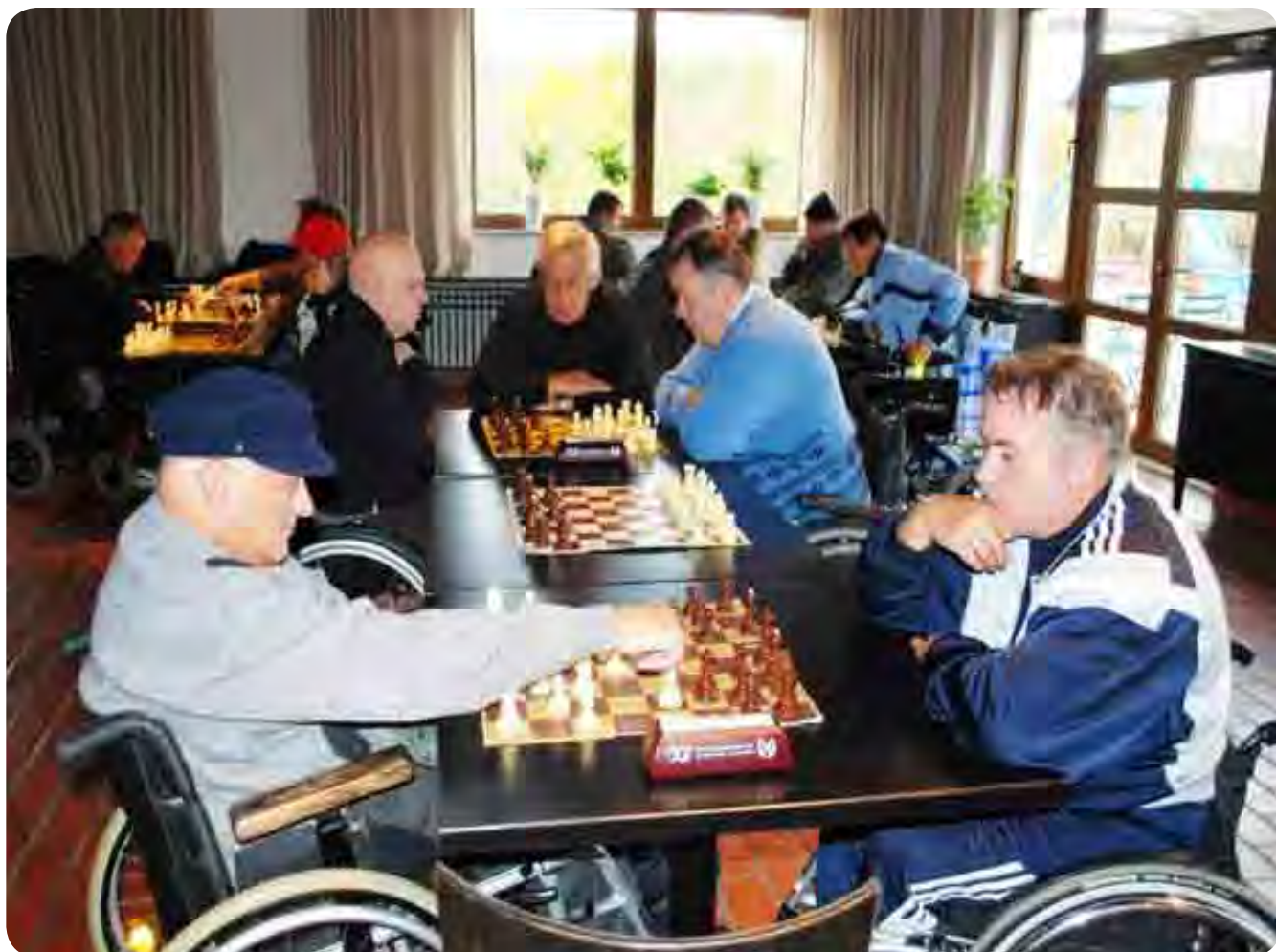
V prenovljenem Gostišču Mahnič so se šahisti pomerili za medalje in pokale.