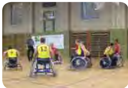
Igralci DPSŠ Maribor v napadu

Mednarodni turnir je potekal v mestecu Gnas v Avstriji od 17. do 19. 9. 2010 v organizaciji FLINK STONES iz Gradca s šestimi sodelujočimi ekipami košarkarjev na vozičkih: Polisportina Nordest (IT), Flink Stones (AUT), KIK Stela Zagreb (HR), Kranj (SLO), Carinthia Broncos (AUT) in DPSŠ Maribor (SLO). Na tem turnirju so košarkarji DPSŠ zasedli 4. mesto.